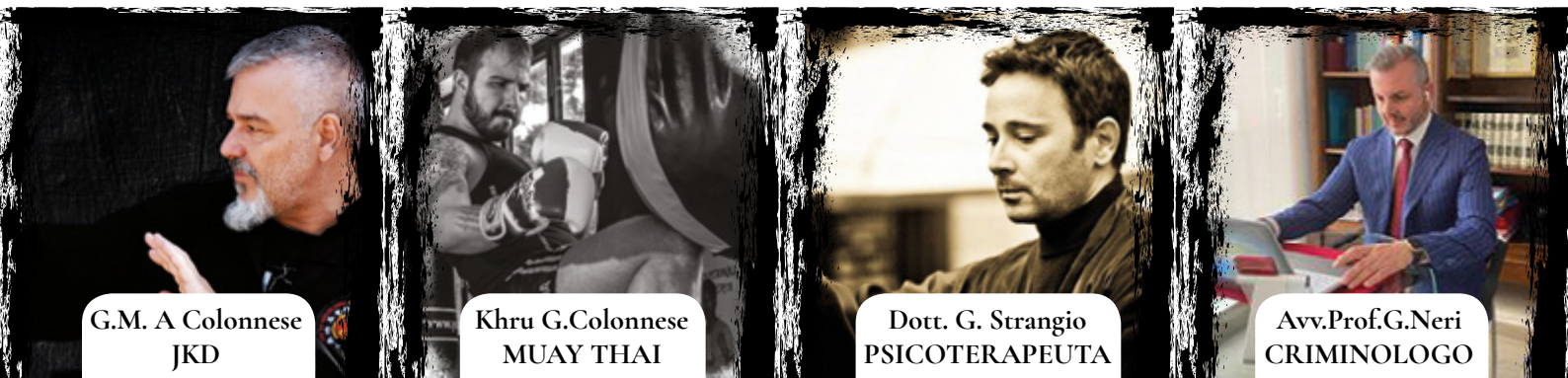
G.M. A Colonnese JKD

In data 11/12 marzo all'atto dell'iscrizione al 1° modulo di pratica, dovrà essere versata la prima rata di 150€ che consentirà il ritiro del kit previsto dal percorso formativo.