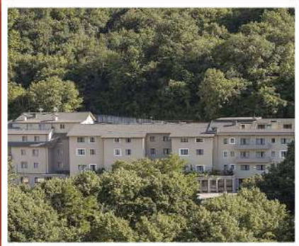
La MONTE MERAVIGLIA

Saremo ospiti del Gruppo Magrelli Hotels & Restaurant